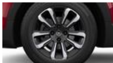
16" disky z ľahkých zliatin BiColor striebornočierno s 10 lúčmi (ZHE0/ZHE2)