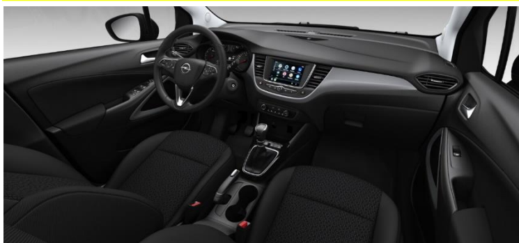
Čalúnenie látkové Peanut, čierne Jet Black R5FX