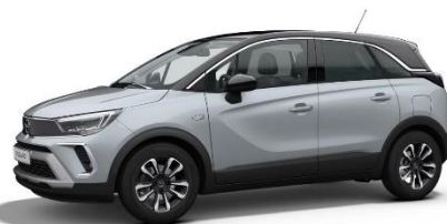
Šedá Kristall (ZRM0) 550 €