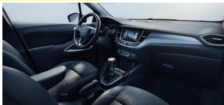
Čalúnenie kombináciou koža/látka Sparkle, čierne Jet Black, s ergonomickým sedadlom vodiča AGR – Sada Elegance – TUFX