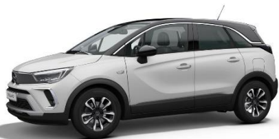
Bielá Arktis (WPP0) 0 €