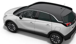
Čierna strecha Diamond Black (JD20) Edition / Elegance 150 €