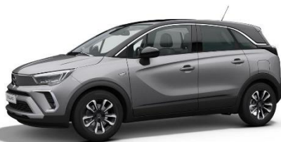
Šedá Kontrast (F4M0) 550 €