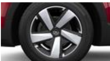
16" štruktúrované oceleové disky s strieborno-čiernym krytmi (ZHD1)