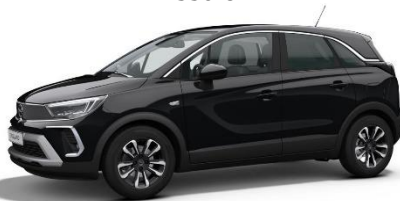
Čierna Karbon (9VM0) 550 €