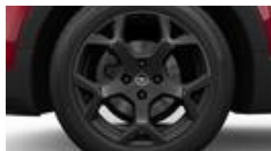
17" x 6,5J čierne disky z ľahkých zliatin so 4 dvojitémi lúčmi (ZHE5/ZHE6)