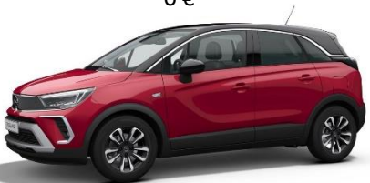
Červená Kardio (PQM0) 550 €