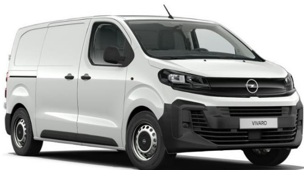
Biela Kaolin (PRP0) 0 €