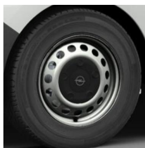
16" ocelové disky