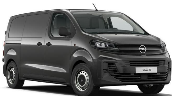
Šedá Merkur (1JM0) 600 €