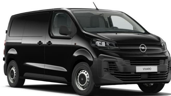
Čierna Karbon (9VM0) 600 €