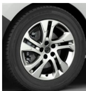
17" disky z ľahkej zliatiny (ZHSL) 740 €