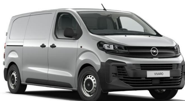
Šedá Kontrast (F4M0) 600 €